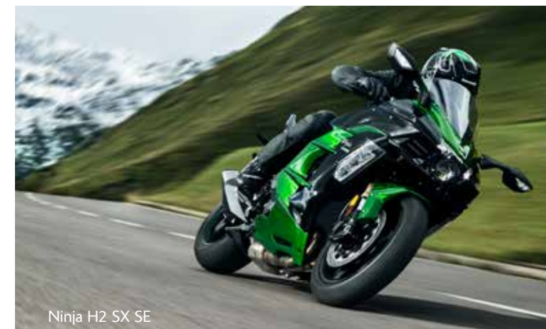
Ninja H2 SX SE

HOLEN SIE SICH DEN KAWASAKI STARTER-BONUS!