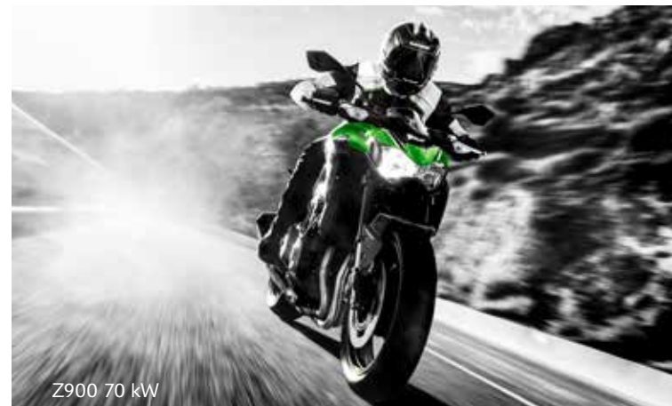
Z900 70 kW